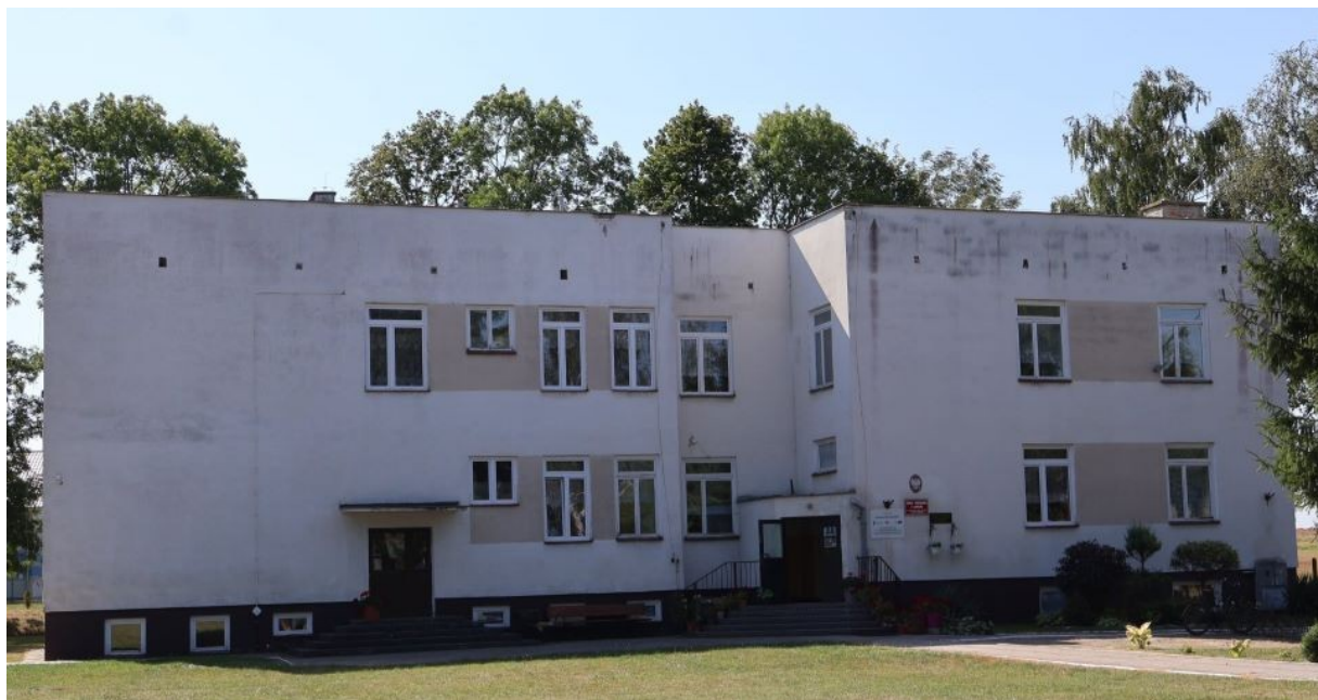
Zdjęcie 3. Budynek Szkoły Podstawowej w Sahryniu.