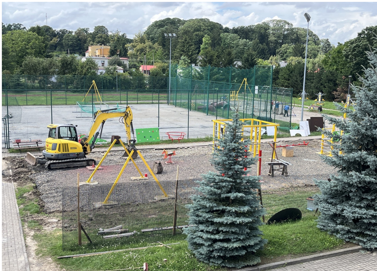
Zdjęcie 6. Prace remontowo-modernizacyjne infrastruktury sportowej przy Szkole Podstawowej w Werbkowicach.