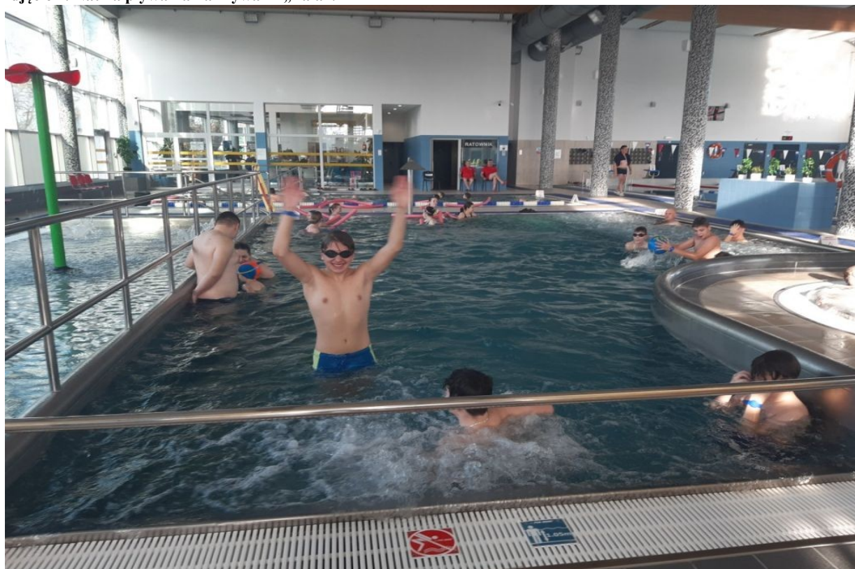
Zdjęcie 4. Nauka pływania na Pływalni „Fala”.