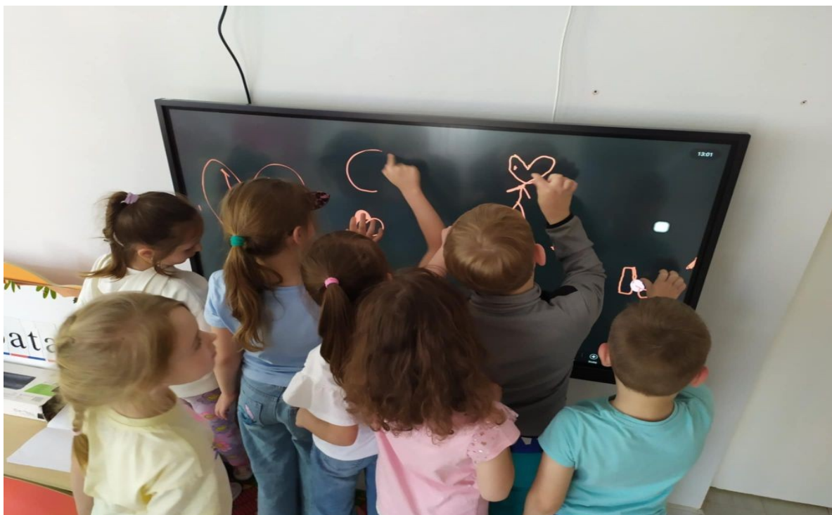
Zdjęcie 8. „Zdrowo- cyfrowo” w Przedszkolu Samorządowym w Werbkowicach.