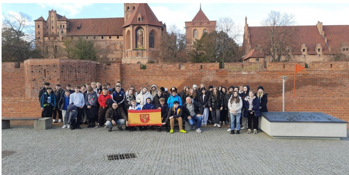
Zdjęcie 9. „Podróże z klasą” w Szkole Podstawowej w Werbkowicach.

W ramach programu w listopadzie 2024 r. uczniowie Szkoły Podstawowej w Werbkowicach odwiedzili takie miejsca jak Gdańsk, Gdynia, Sopot, Półwysep Westerplatte, Półwysep Helski oraz Malbork. Celem przedsięwzięcia było uatrakcyjnienie procesu edukacyjnego dzieci i młodzieży poprzez umożliwienie im poznawania tradycji, kultury oraz osiągnięć polskiej nauki.