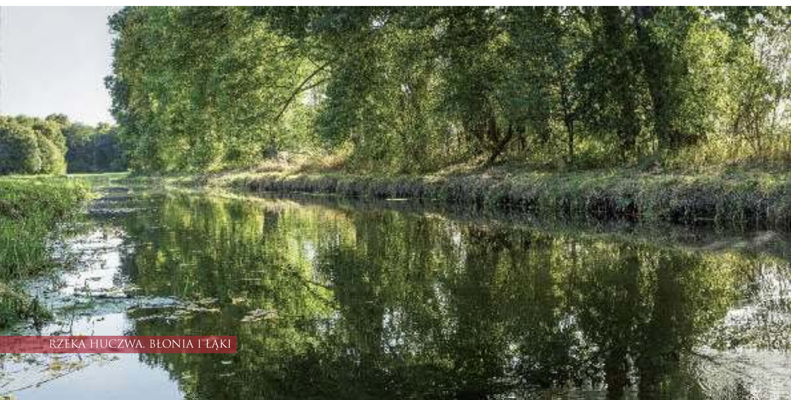
RZĘKA HUCZWA, BŁONIA I ŁĄKI