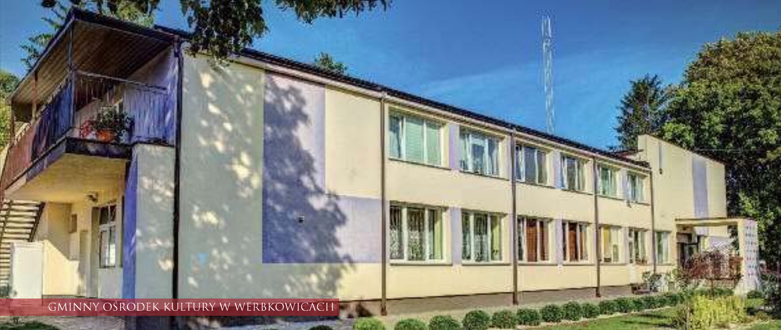
GMINNY OŚRODEK KULTURY W WERBKOWICACH