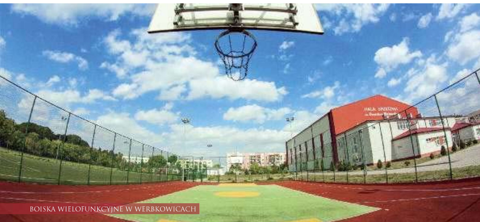
BOISKA WIELOFUNKCYJNE W WERBKOWICACH