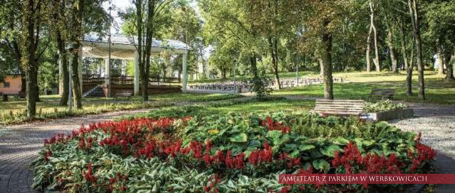
AMFITEATR Z PARKIEM W WERBKOWICACH