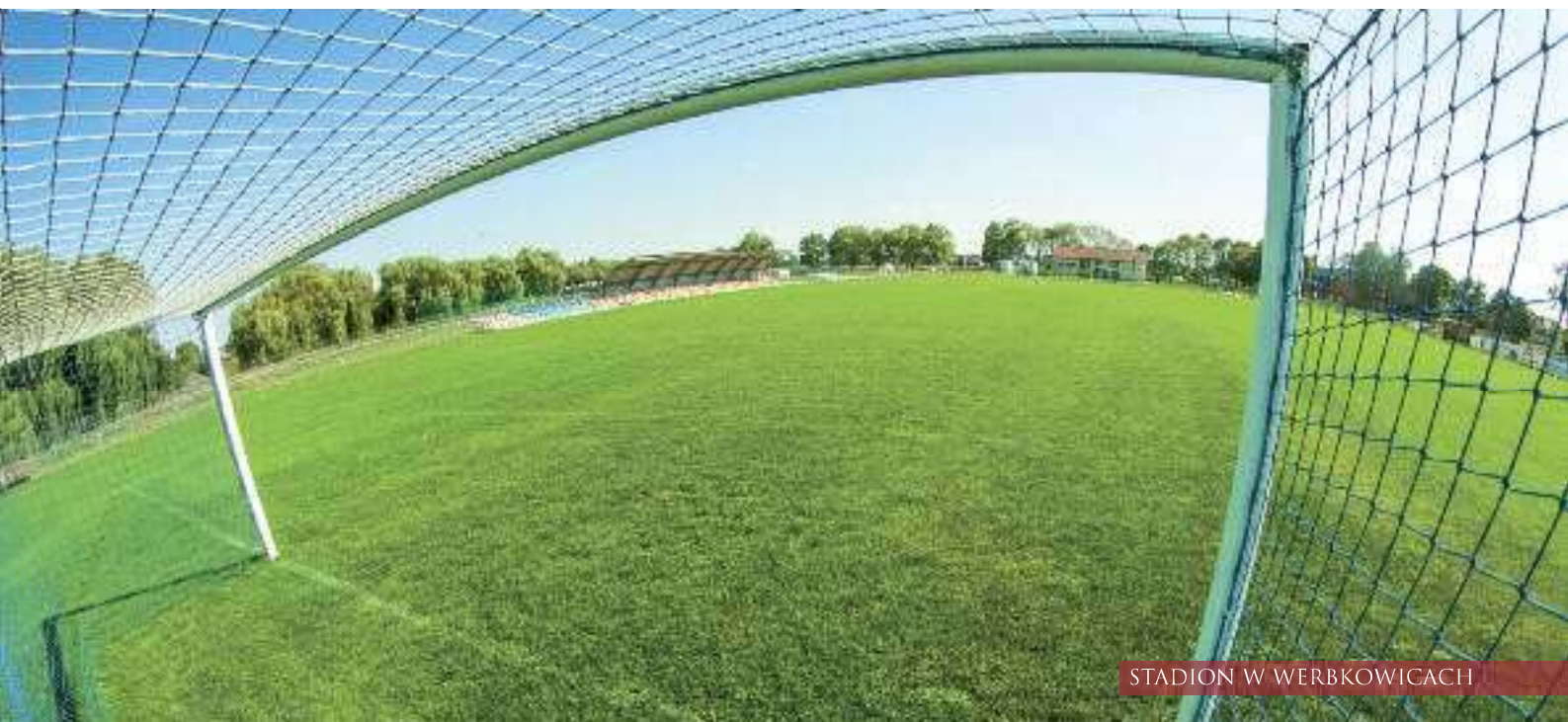
STADION W WERBKOWICACH