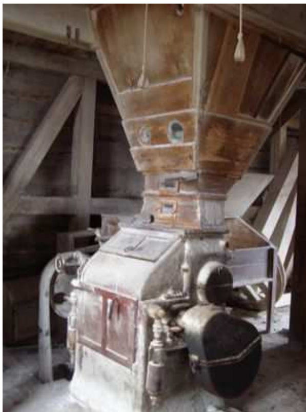
Rys. 15. Wnętrze młyna