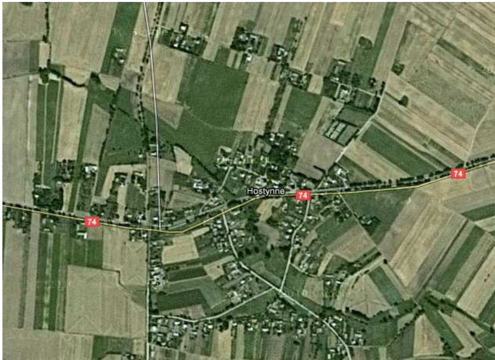
Rys. 3. Hostynne - "Mapka z lotu ptaka"

Powierzchnia gminy Werbkowice zajmuje 18,826 ha (miejscowość Hostynne 613,6813 ha), w tym użytki rolne stanowią 828,67 ha, natomiast lasy 92,52 ha. Gminę Werbkowice tworzy 28 sołectw, w tym sołectwo Hostynne. Jest ona gminą rolniczo – przemysłową z nastawieniem na przemysł rolno – spożywczy.