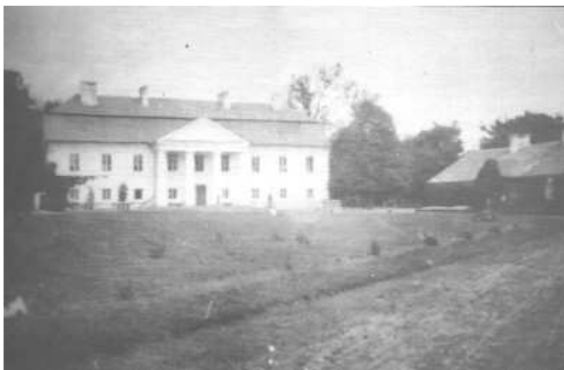
Rys.3. Dwór wbudowany pod koniec XVIII w. przez Jan Suffczyński, zniszczony w 1915 r.

przykryta wysokim łamanym dachem gontowym. W roku 1833 wybudowano przy folwarku magazyn gromadzki.