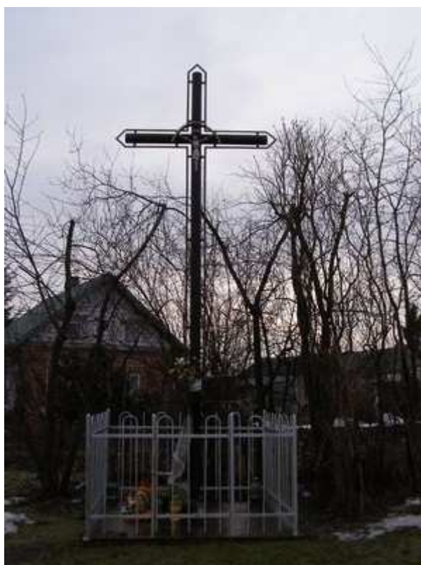
Rys. 7. Przydrożny krzyż