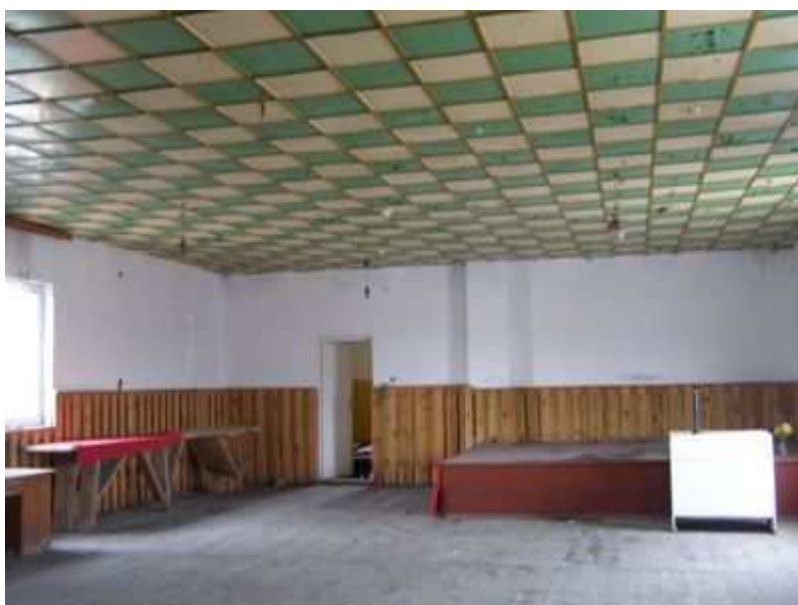
Rys. 18. Sala taneczna