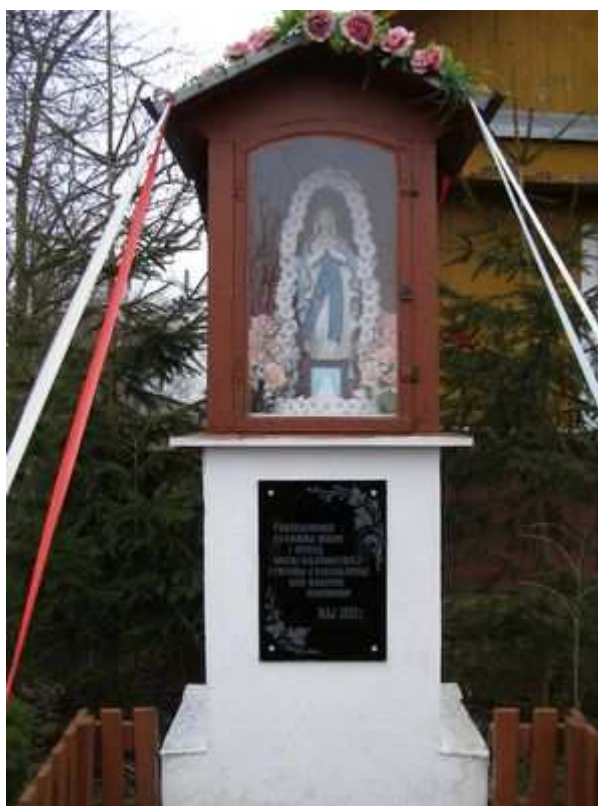
Rys. 6. Przydrożna kapliczka „Podziękowanie za łaski Boże i opiekę Maki Najświętszej z prośbą o dalszą opiekę nad naszymi rodzinami” maj 1993

Na terenie miejscowości znajduje się przydrożny krzyż konstrukcji metalowej i przydrożna kapliczka drewniana z podstawą murowaną z końca XX w. Na placu kościelnym znajduje się drewniany krzyż z poł. XX w. i figura z końca XX w., będące szczególnym miejscem kultu wiary chrześcijańskiej. Przy tych obiektach religijnych w miesiącu maju odbywają się spotkania modlitewne zwane "majówkami", oraz poświęcenie pól.