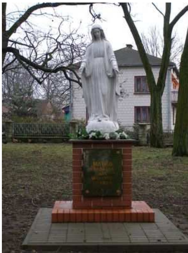
Rys. 9. Figura na placu kościelnym „Matko wspomagaj nas w drodze do nieba” 2006