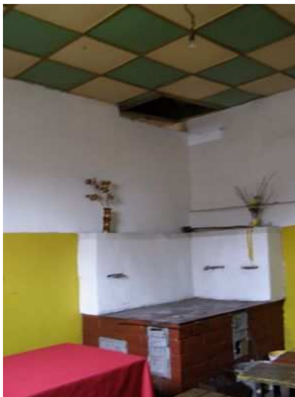
Rys. 19. Pomieszczenie kuchenne