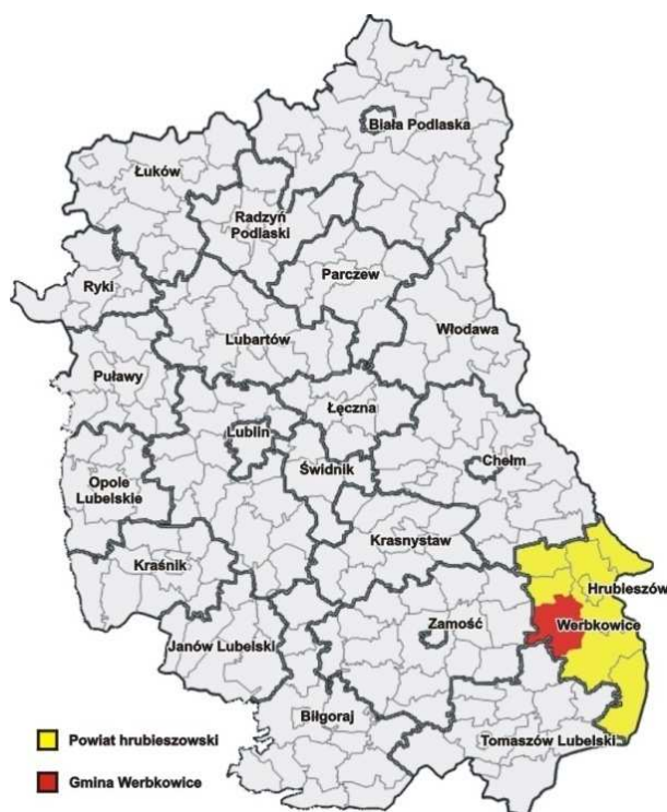
Rys. 1. Gmina Werbkowice na tle województwa lubelskiego i powiatu hrubieszowskiego

Miejscowość Hostynne leży w odległości 18,8 km od miasta powiatowego Hrubieszowa, w sąsiedztwie z miejscowościami: Hostynne – Kolonia, Dobromierzyce, Peresołowice, Werbkowice, Konopne, Łotów.