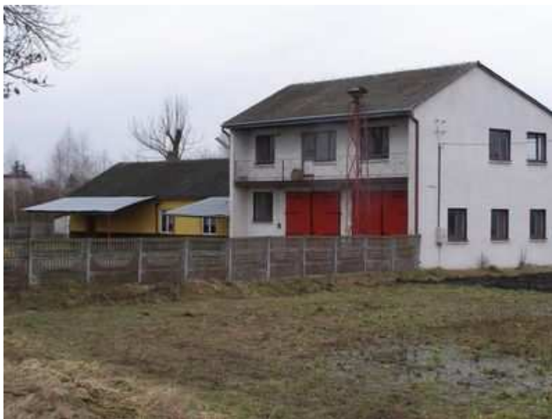
Rys. 16. Świetlico-remiza

Pomimo powyższych braków organizowane są w świetlicy dużym nakładem społecznym, imprezy dla mieszkańców. W programie festynów są konkursy i zabawy dla dzieci przeprowadzone przez pracowników GOK Werbkowice. W trakcie imprez uczestnicy delektują się ciastem upieczonym przez panie z KGW, oraz grochówką, potrawami z grilla oraz napojami. Wszystko odbywa się przy muzyce prezentowanej dla każdego pokolenia w formie festynu rodzinnego.