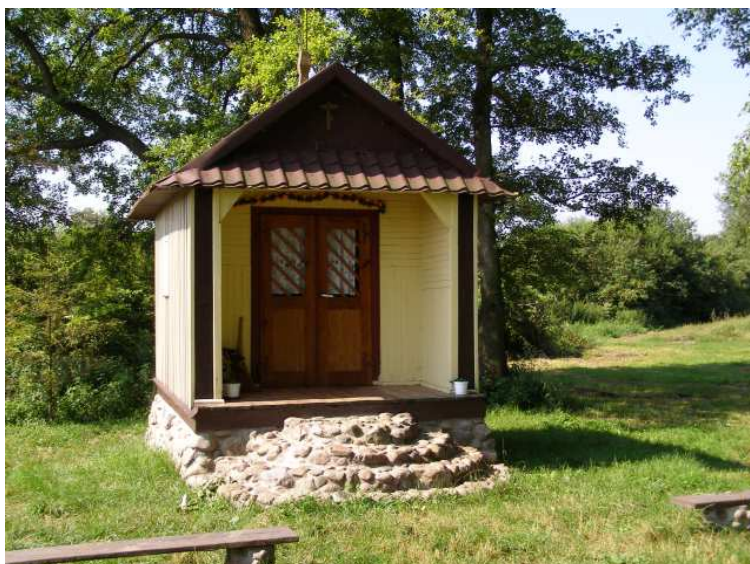
Rys. 11. Kaplica Kryniczna w „Krynkach” p. w. M. B. Kryńskiej z 1863 roku

źródłem. Wg przekazywanego podania, miała tu chronić się miejscowa ludność podczas napadów tatarskich, a kaplicę miał wznieść dziedzic sąsiedniej wsi (nie wiadomo jednak której). Obecna kaplica wybudowana została w 1863 roku, o czym świadczy data na drzwiach i narożnym słupie. Kaplicę remontowano w 1911 roku i w latach 90 ubiegłego wieku. Znajduje się w niej drewniana figura Matki Bożej z Dzieciątkiem (dawniej umieszczona była w ołtarzyku z figurkami adorujących aniołków). Miejscowi nazywają ją Matką Bożą Kryńską lub Krynecką, od miejsca lokalizacji kaplicy na źródle czyli krynicy. Spod południowej ściany kaplicy wypływa źródło (obecnie obudowane betonowymi kręgami), z którego woda uznawana jest za cudowną, posiadającą właściwości lecznicze. Do kaplicy nad źródłem przybywają pielgrzymi oraz turyści, nawet z dalekich stron. Najwięcej wiernych gromadzi uroczystość odpustowa, przypadająca w trzecią niedzielę maja. Wówczas w kaplicy odprawiana jest Msza święta pod przewodnictwem proboszcz parafii w Hostynnem. Pątnicy zostawiają w kaplicy wota (gipsowe figurki, obrazki, różańce, koraliki).