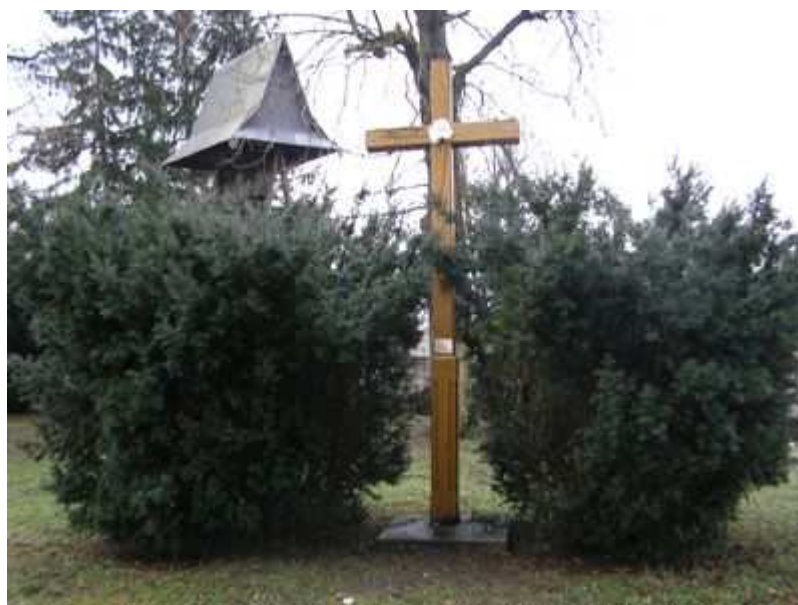
Rys. 8. Krzyż na placu kościelnym pamiątka misji świętych 31. V. 1968 rok