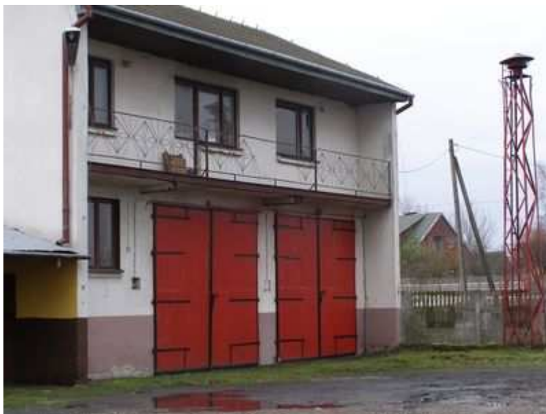
Rys. 26. Budynek wiejskiej remizo-świetlicy /pater cz.remizowa/