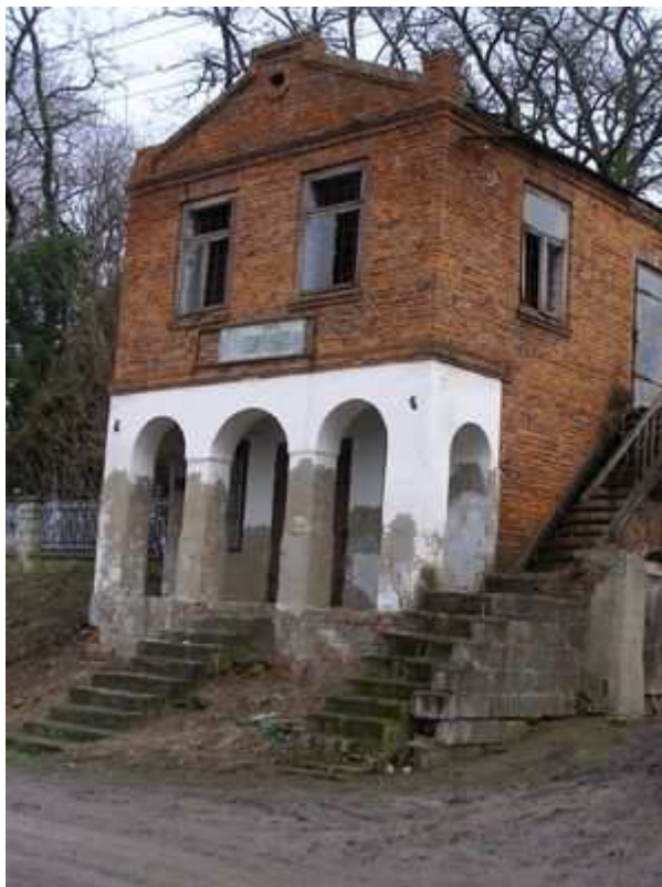
Rys. 4. Budynek byłego sklepu z pierwszej poł. XX wieku.

1935-1938 to okres rozwoju handlu - powstały i funkcjonowały w miejscowości 3 sklepy żydowskie. Po wyzwoleniu pozostał tylko jeden sklep, który w 1949 roku przejęła Gminna Spółdzielnia z Werbkowic i prowadziła tu handel do 1991 roku. W następnych latach powstały sklepy prywatne.