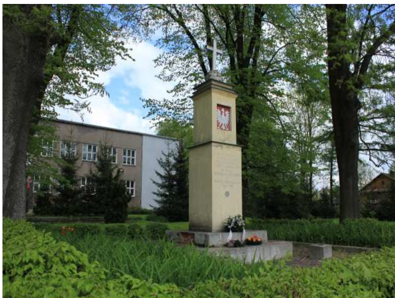
Rys. 10. W bardzo bliskim sąsiedztwie w Hostynnem – Koloni pomnik ku czci 30-go Pułku Strzelców Kaniowskich poległych za wolność i za Niepodległość Ojczyzny w 1920 w walkach na naszych terenach z Sowiecami