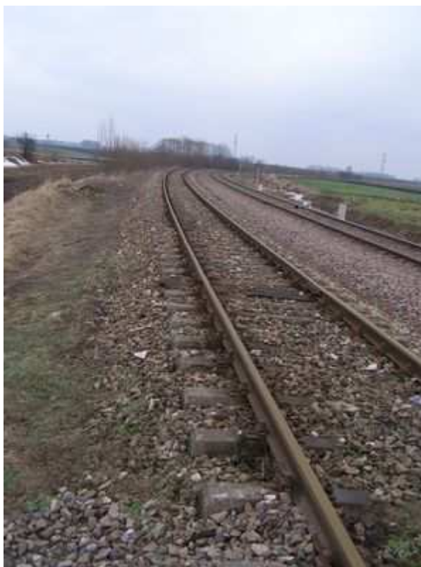
Rys. 24. Linia Hutnicza Szerokotorowa (LHS)