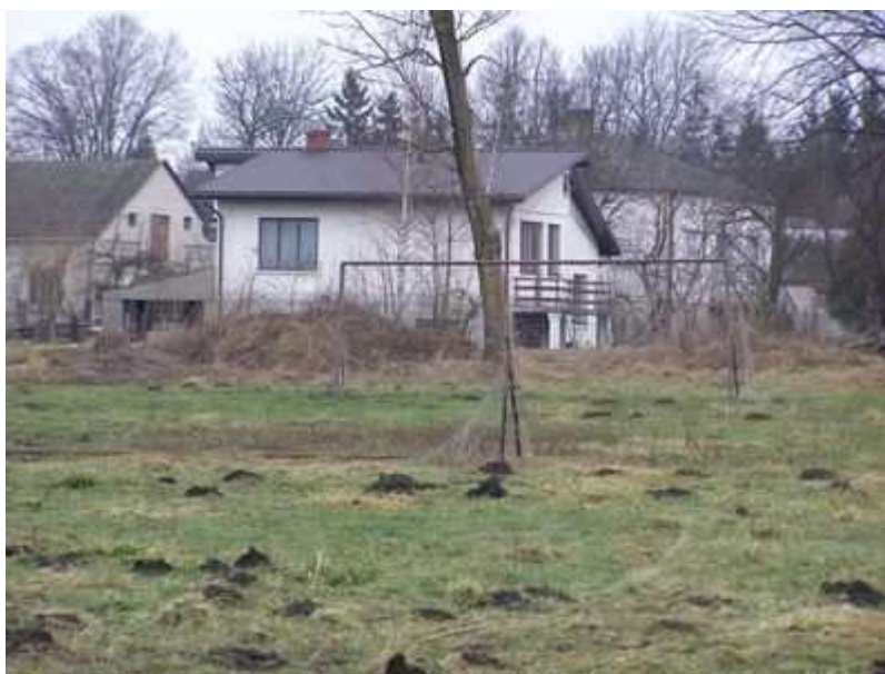
Rys. 21. Obecna infrastruktura boiska sportowego