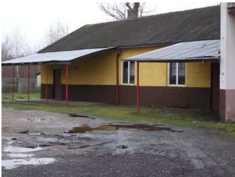
Rys. 17. Część świetlicowa