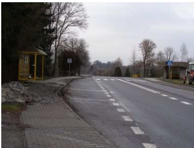
Rys. 23. Droga krajowa Nr 74 Sulejów – Granica Państwa

administracyjnych gminy Werbkowice długość tej drogi wynosi 2,4 km. Droga ta o szerokości jezdni 7,0 m i utwardzonej nawierzchni przystosowana jest do przenoszenia zwiększonych obciążeń ma bardzo duże znaczenie gospodarczo – komunikacyjne. Pełni funkcję drogi tranzytowej do przejścia granicznego w Zosinie.