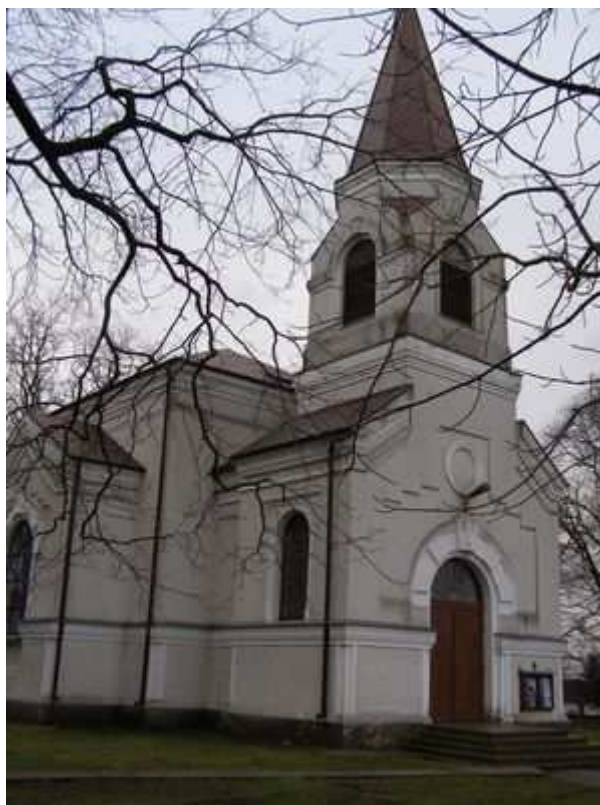
Rys. 5. Kościół Parafialny p.w. Św. Jana Chrzciciela