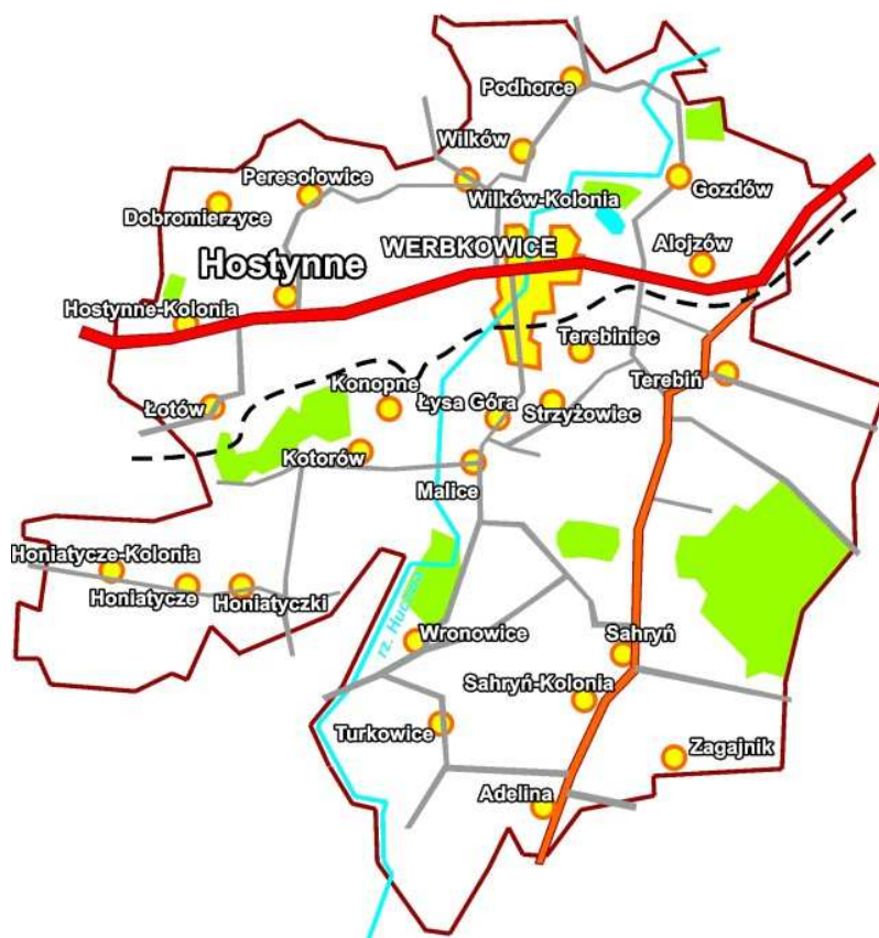
Rys. 2. Miejscowość Hostynne na tle gminy Werbkowice