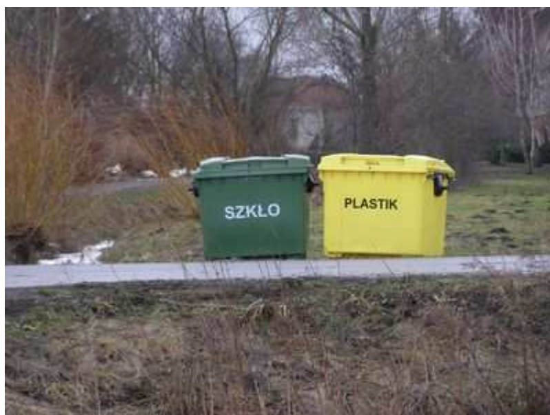
Rys. 25. Pojemniki na odpady o kubaturze 120 l