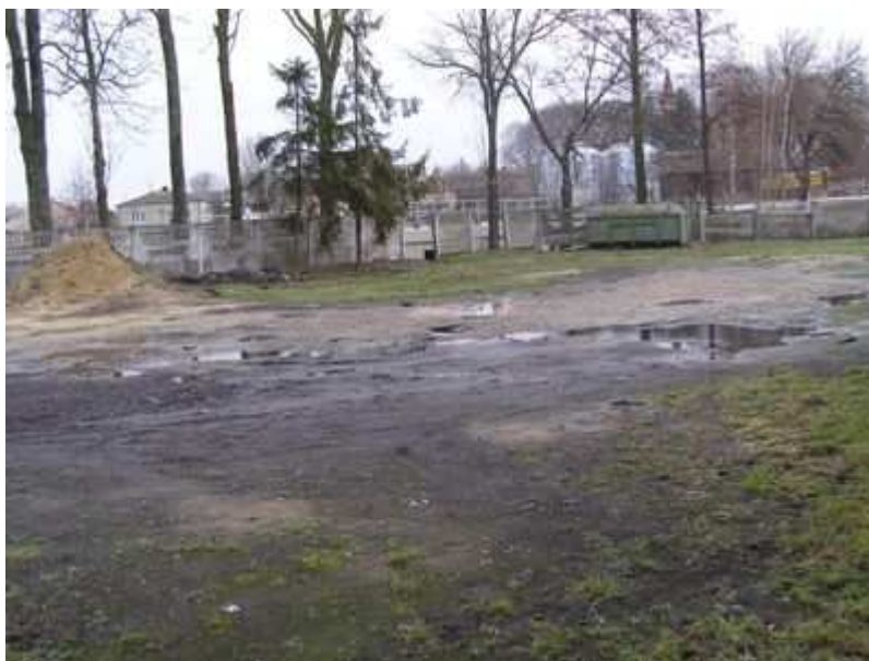
Rys. 20. Plac przed świetlicą-remizą