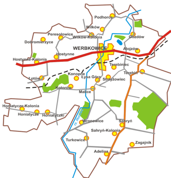
Mapa Gminy Werbkowice

Gmina Werbkowice jest gminą graniczną powiatu, sąsiaduje ona z :