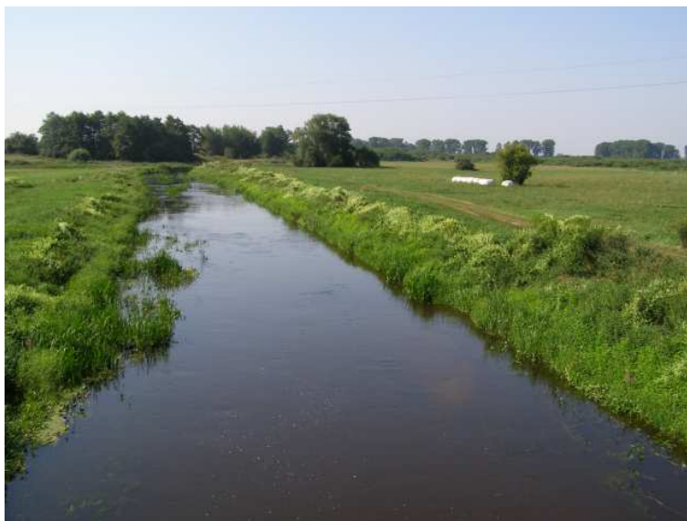
Rys. 4 Rzeka Huczwa