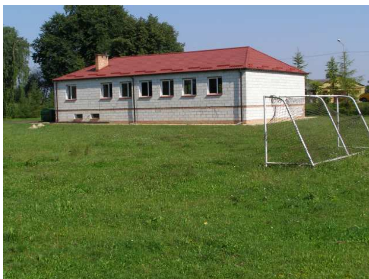
Rys. 11 Świetlica Wiejska w Kotorowie

Cały obiekt nie jest ogrodzony, teren nie jest zagospodarowany (m.in. brak utwardzonego placu dojazdowego, obiektów małej infrastruktury typu: plac zabaw, boiska sportowo-rekreacyjnego). Brak infrastruktury wodno-kanalizacyjnej, sanitariatów.