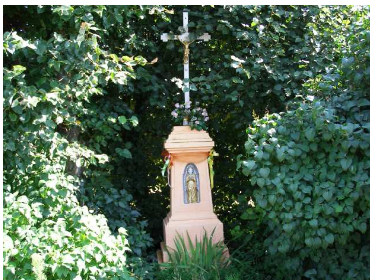
Rys. 7 Krzyż prawosławny