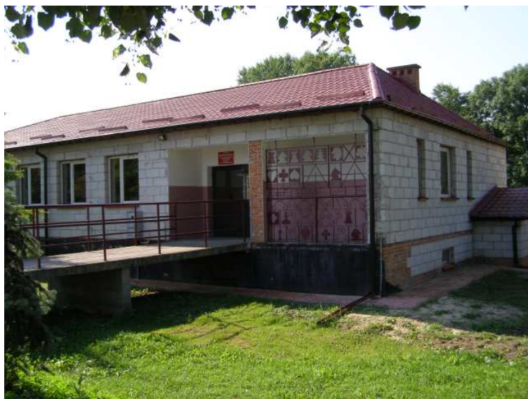
Rys. 10 Świetlica Wiejska w Kotorowie