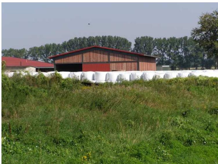
Rys. 13 Budynki gospodarcze IUNG-u

Do ważniejszej inwestycji w Kotorowie doszło w 1959 roku, kiedy na gruntach werbkowickiego IUNG-u rozpoczęto budowę Gospodarstwa Rolnego w Kotorowie. Wybudowano wówczas kilka budynków gospodarczych i jeden mieszkalny. Zakład zatrudnia 24 osoby. Gospodarstwo głównie nastawione jest na produkcję mleka rocznie produkuje około 3 000 000 l mleka i jest największym producentem mleka w Gminie Werbkowice. W gospodarstwie obecnie jest około 750 sztuk bydła. Użytkuje grunty o powierzchni 520 ha. Gospodarstwo posiada dwie duże obory, wiatę paszową i ubojnię.