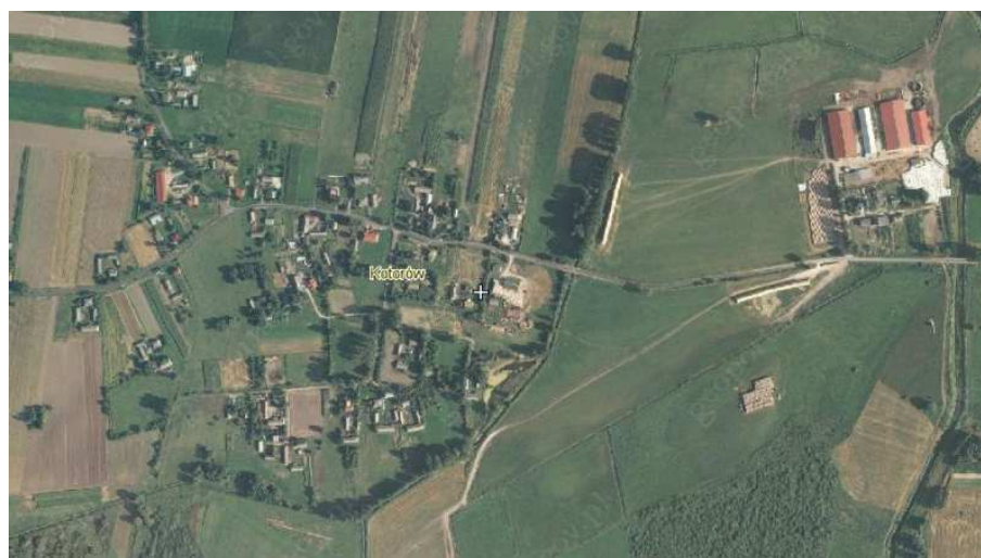
Rys.3. Kotorów z lotu ptaka

Powierzchnia gminy Werbkowice zajmuje 18,826 ha (miejscowość Kotorów 4499,71m 2 ), w tym użytki rolne stanowią 427 ha. Gminę Werbkowice tworzy 28 sołectw, w tym sołectwo Kotorów. Jest ona gminą rolniczo-przemysłową z nastawieniem na przemysł rolno-spożywczy.