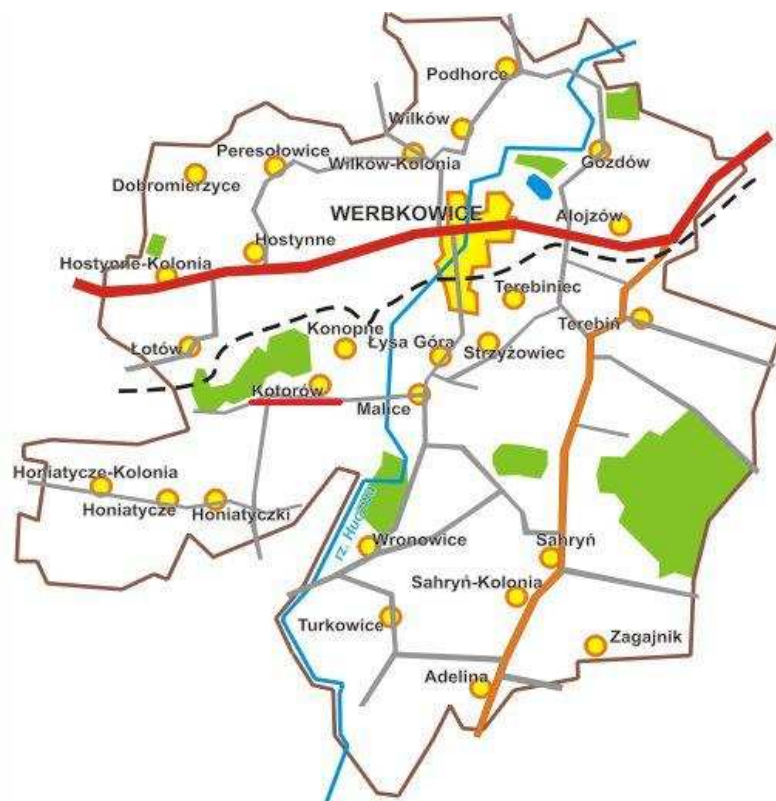
Rys. 2. Miejscowość Kotorów na tle gminy Werbkowice