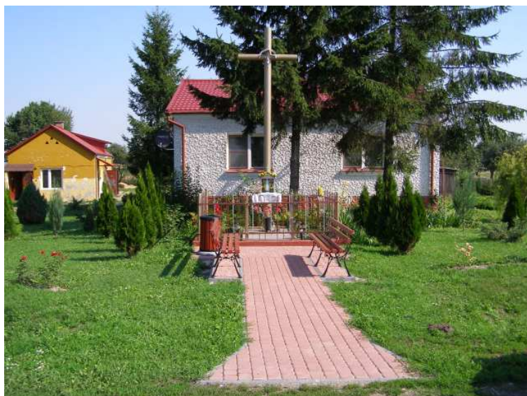
Rys. 6 Przydrożny krzyż