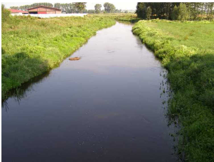
Rys. 5 Rzeka Huczwa