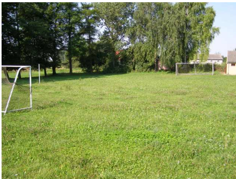
Rys. 12 Boisko do piłki nożnej i siatkówki

Również usytuowane jest przy świetlicy. Nawierzchnia boiska jest nierówna, nieprzystosowana do uprawiania dyscypliny, elementy konstrukcyjne wyposażenia są przestarzałe i nie funkcjonalne.