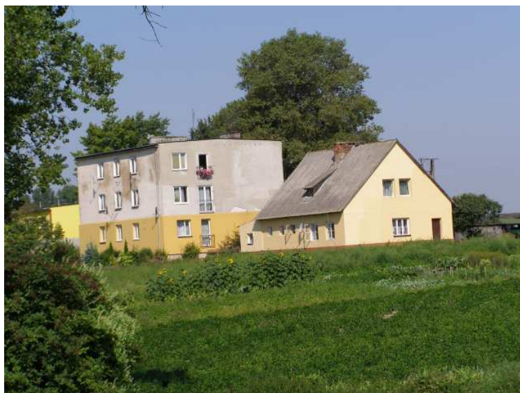
Rys. 14 Budynki mieszkalne IUNG-U